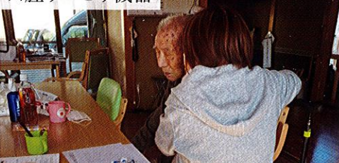
口腔リハビリ機器

1分間の唾液の分泌量を機能訓練指導員と共に実施しています。デリケートな対応を心がけています。