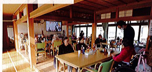
ダイニングスペース

日差しのある暖かな部屋で、機能訓練やスタッフと一緒に料理などをするみんなの憩いの場です。