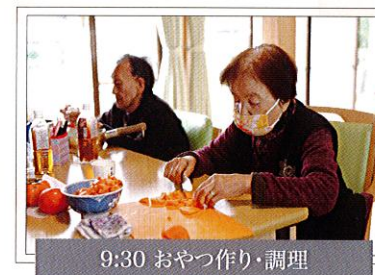
9:30 おやつ作り・調理